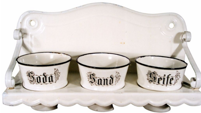
Ein Satz von Emaille-Erzeugnissen